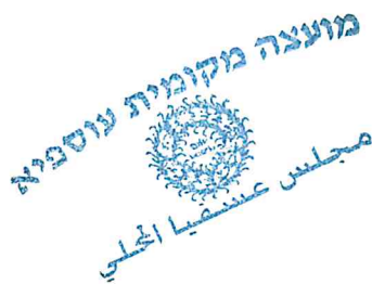
פרח שרוף מזכיר המועצה